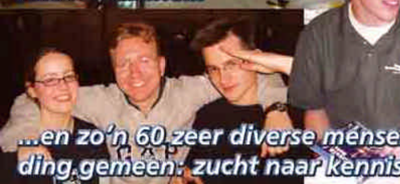
...en zo'n 60 zeer diverse mensen, met één ding gemeen: zucht naar kennis en plezier!

De manier om kennis te maken met de JD. Ben je pas lid, of dank je er over lid te worden? Kom dan ook! Oefen in debatten, voer discussies, ondervraag een kamerlid, leer, geniet, feest! Kortom: beleef het beste weekend van de JD!